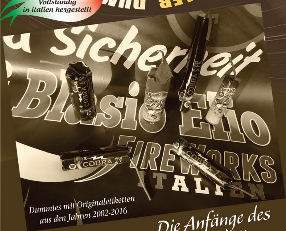
Dummies mit Originaletiketten aus den Jahren 2002-2016